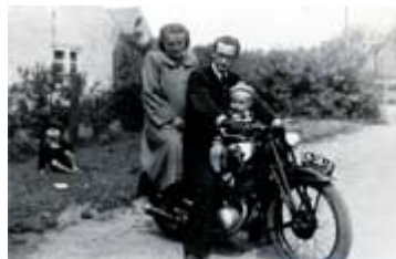
Mutter, Vater, erstes Kind 1953 in Ostpreußen