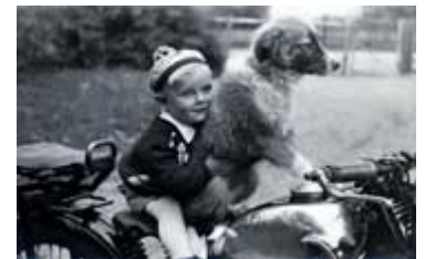
...mit seinem Hund Rex 1953 in Ostpreußen