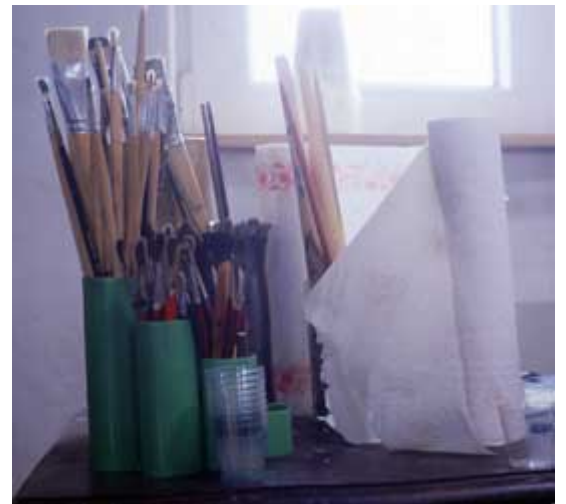
Malutensilien des Künstlers