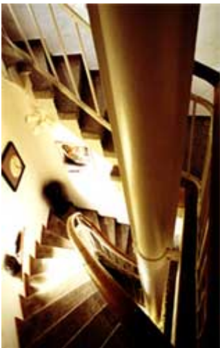
Der Weg nach oben (Treppenhaus im Turm)

Waldemar Jan Erdtmann, Künstler, Architekt und Ingenieur, lebt im markantesten Bau über allen Dächern der Stadt Frechen, im alten Wasserturm. Eine schmale Wendeltreppe führt hinauf ins Atelier - einen verschlungenen Weg ging der Künstler, um dorthin zu gelangen.