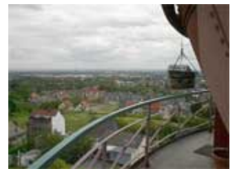
Der Fotografenkoffer hoch über den Dächern am Ziel angekommen