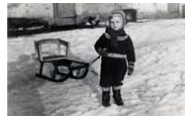
...im Masurischen Winter auf dem Bauernhof 1954