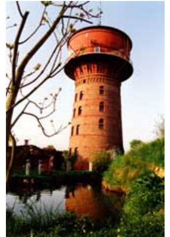
Das Atelier oben in der Stahlkugel