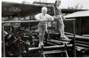
...mit dem Bruder "Bubi" auf dem Brunnenbauerhof