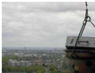
Der Fotografenkoffer nach oben im Lastenaufzug

aus der Feder des Journalisten M. Junggeburch