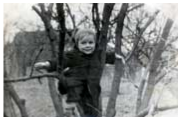
...hoch klettern musste er schon in frühen Jahren